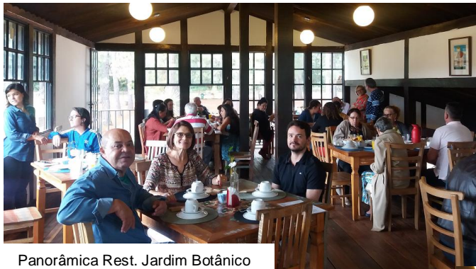
Panorâmica Rest. Jardim Botânico

Em meio à natureza, no Jardim Botânico de Brasília, comemoramos o Dia das Mães. O encontro foi realizado no dia 21 de maio com café da manhã no Restaurante Jardim Bom Demais.