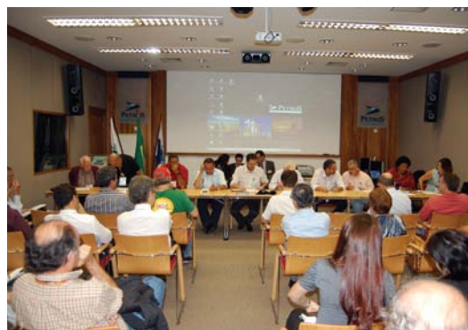
Durante o anúncio do resultado das eleições, o auditório da Petros ficou lotado de participantes da Fundação

Candidatos apoiados pela AMBEP são eleitos para os conselhos Deliberativo e Fiscal