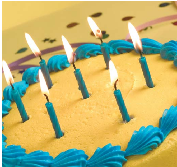
Banco de imagens

Contamos em nossos quadros com ambepianos e ambepianas de diversas fases importantes da Petrobras. São aposentados, pensionistas e participantes ativos das gera-