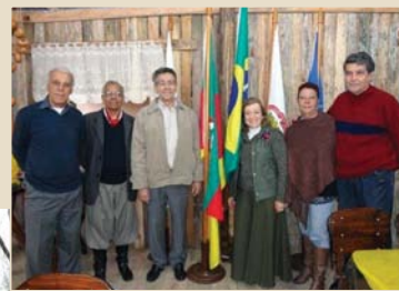
Ao lado, dirigentes da AMBEP prestigiaram o evento

A Semana Farroupilha é uma festa tradicional que lembra o início da maior revolução do Brasil, que durou 10 anos e tinha como ideal a fundação de uma república independente do antigo império brasileiro. Todos os anos, o evento acontece entre os dias 14 e 20 de setembro, e conta com desfiles pela cidade em homenagem aos líderes da Revolução.