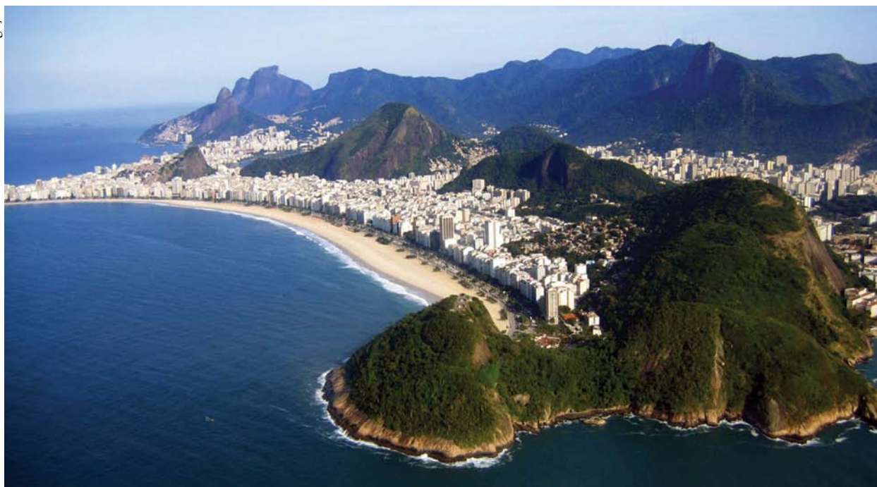
A Cidade Maravilhosa reúne cartões-postais exuberantes

O Centro do Rio esconde relíquias da arquitetura e da história e merece pelo menos um ou dois dias de passeio. Uma boa pedida é começar a visita pelo Centro Cultural Banco do Brasil, que sempre reúne boas exposições, e dali partir a pé até o Paço Imperial. No caminho, o Arco do Teles reúne uma boa seleção de bares e restaurantes, que ficam cheios especialmente durante a semana e no Happy Hour, e ainda conta um detalhe pitoresco: no local fica uma casa onde viveu Carmem Miranda. Atualmente um centro cultural, o Paço Imperial foi construído no século XVIII para abrigar o Rei de Portugal, Dom João VI, e os imperadores do Brasil. Logo ao lado fica o Palácio Tiradentes, sede da Assembleia Legislativa do Rio. Nos arredores, estão localizados a Igreja da Candelária e o Saara, este, um polo comercial que reúne lojas das mais varia-