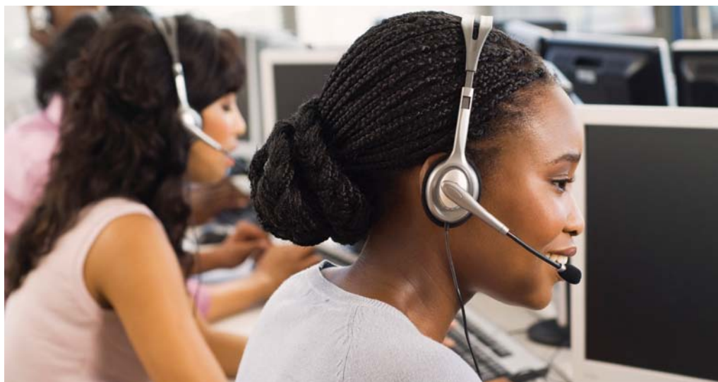
Banco de imagens

A AMBEP ampliou o serviço do Call Center para reduzir a espera nas ligações realizadas para o 0800 do IPAM (Indicação de Profissionais para a Área Médica). Com mais boxes de atendimento, a ideia é oferecer ainda mais segurança e agilida-