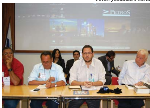
A Comissão Eleitoral conduziu a apuração de votos e anunciou os vencedores do pleito