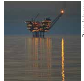
Banco de imagens

Em março, foram produzidos 53,467 milhões de metros cúbicos de gás natural por dia nos campos nacionais, o que representou um aumento de 6,6% em relação à média diária extraída no mesmo mês de 2010. A produção de gás natural manteve-se estável em comparação com fevereiro deste ano.