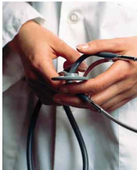
Banco de imagens

assinatura de qualquer ficha de controle de pagamento e de autorização, já que é responsabilidade do usuário pagar as despesas.