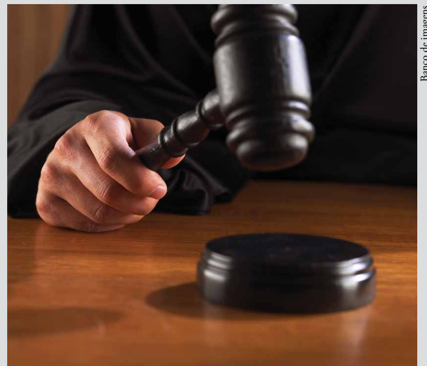
Banco de imagens