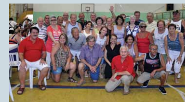
Churrasco animado em Santos na confraternização de fim de ano

Em Santos, os associados da AMBEP celebraram o fim do ano no dia 17 de dezembro. Um excelente churrasco com direito a música ao vivo reuniu cerca de 400 pessoas no Clube Cepe 2004, fechando 2011 em alto astral!