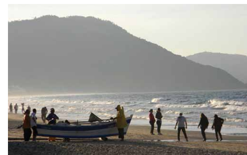
Praia dos Ingleses