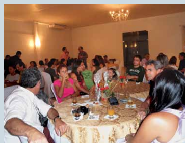
Os Associados, seus beneficiários e convidados lotaram o Raquel Buffet

Com a presença de 120 pessoas, entre associados, seus familiares e convidados, foi realizada no dia 9 de dezembro a festa de final de ano da capital cearense. O palco da confraternização foi o Raquel Buffet, onde a animação ficou a cargo de Rafael Holanda e Banda. Um dos pontos altos da celebração foi o sorteio de vales brindes das Lojas Riachuelo entre os associados que prestigiaram o evento.