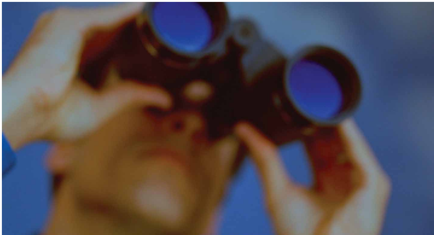
Banco de imagens

Após um ano de muito trabalho, marcado pelas inesquecíveis celebrações dos 30 anos da AMBEP por todo o país, é hora de retomarmos o fôlego para reafirmarmos o compromisso com a defesa dos direitos dos nossos associados.