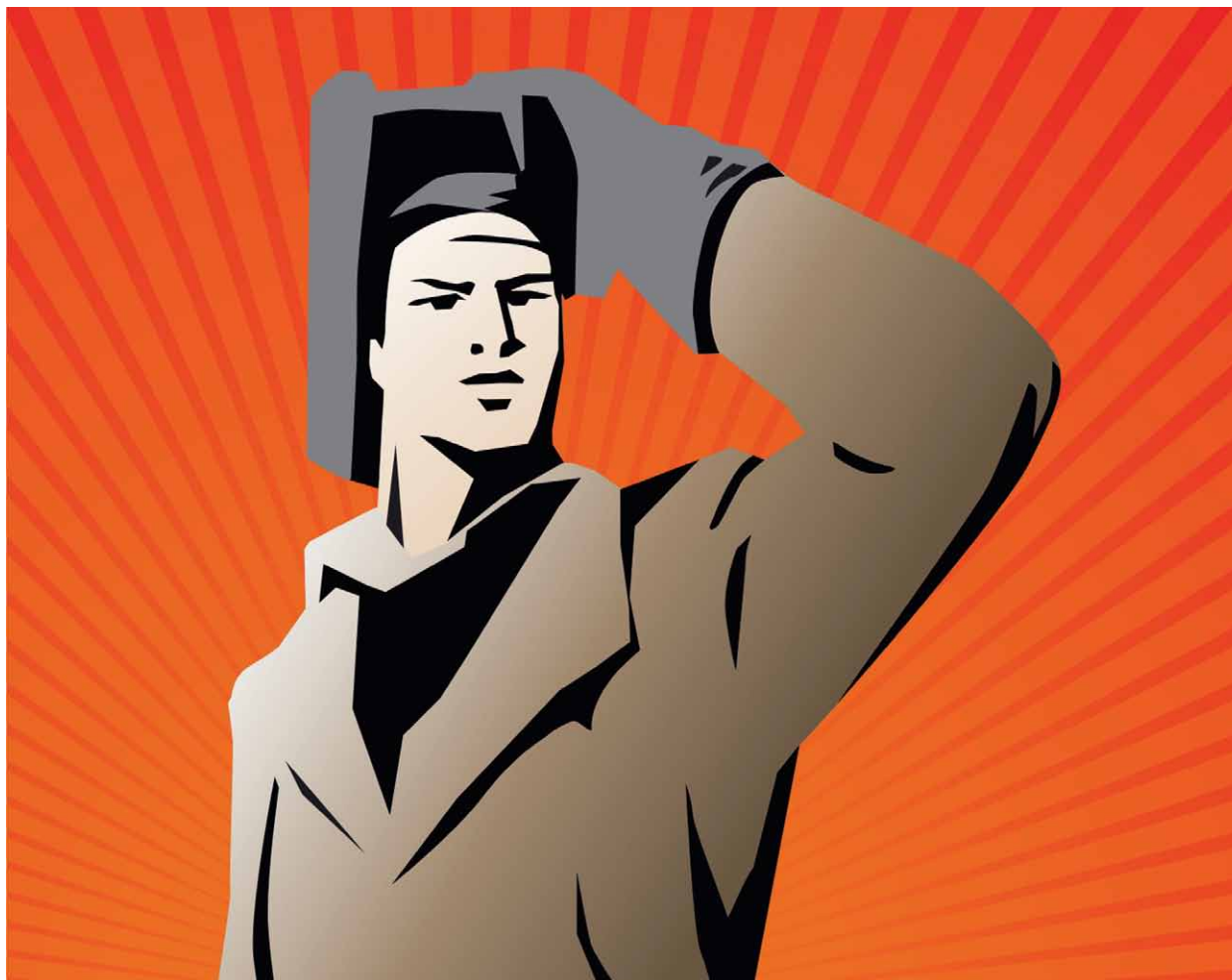
Banco de imagens

No caso específico da Petrobras, as consequências serão desastrosas aos interesses nacionais. Basta considerar o contexto de peculiaridades que a tornam ímpar em nosso cenário empresarial estratégico, tornando-se, portanto, fundamental que sejam necessariamente intransferíveis suas atribuições legais, em regra altamente especializadas, como, por exemplo, a realizada pelo seu Centro de Pesquisas (Cenpes), responsável, entre outros, pelo pioneiro e valioso “Pré-sal”. Também em razão das características próprias da indústria do petróleo, não há