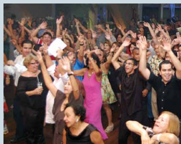
Os 800 convidados divertiram-se ao som de hits da Orquestra Tupy