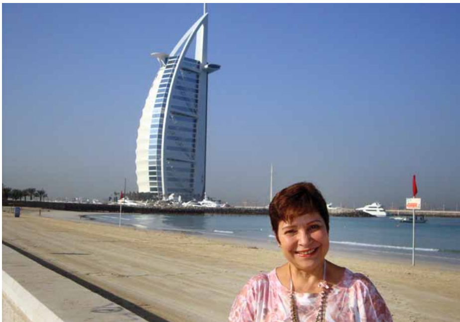
A ex-coordenadora de RH da Petrobras passou o Réveillon em Dubai com as amigas