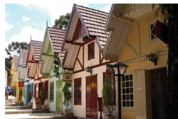
O charme do centro de Monte Verde