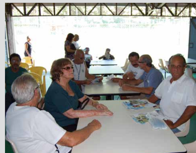
Dúvidas sobre a Ipam, plano de saúde e convênios médicos foram esclarecidas aos sócios