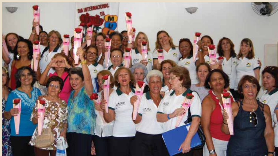
Dia da Mulher: comemoração está sendo preparada em Representações por todo país

Em Macaé (RJ), a festa promete! As mulheres serão homenageadas em um evento que também vai contemplar o Dia das Mães e os aniversariantes de janeiro, fevereiro e março. Os ambebianos macaenses já começaram a contagem regressiva para o evento, que acontecerá no mês de maio.