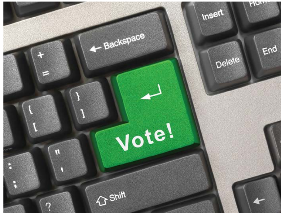
Banco de imagens

Esse pleito é da maior responsabilidade, trata-se da Petros. Diz respeito à origem de recursos para a manutenção da nossa vida e de muitas outras famílias por tempo indeterminado. Por isso mesmo, temos a obrigação de