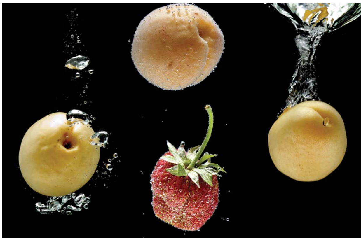
Banco de imagens

• Na compra de enlatados há um indício seguro de alteração: o estufamento da lata, que raramente acontece devido ao excesso do conteúdo. Embalagens enferrujadas e amassadas devem ser recusadas.