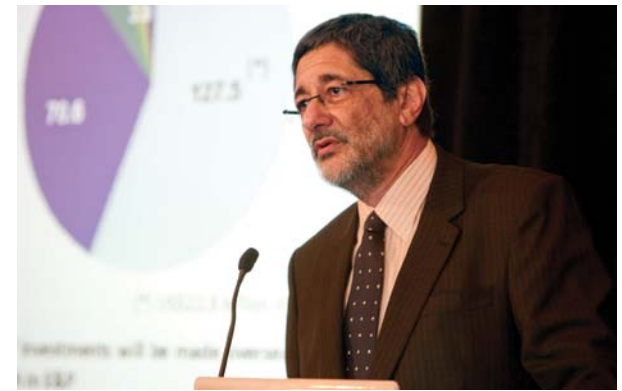
José Sergio Gabrielli de Azevedo, presidente da Petrobras

Gabrielli destacou a política de conteúdo nacional e os investimentos em pesquisa e desenvolvimento que têm motivado empresas internacionais a se instalarem no Brasil para atuar no setor de petróleo e gás. Equipamentos a serem utilizados em larga escala como válvulas, linhas flexíveis e turbinas serão construídos por companhias como Cameron, Wellstram e Rolls-Royce.