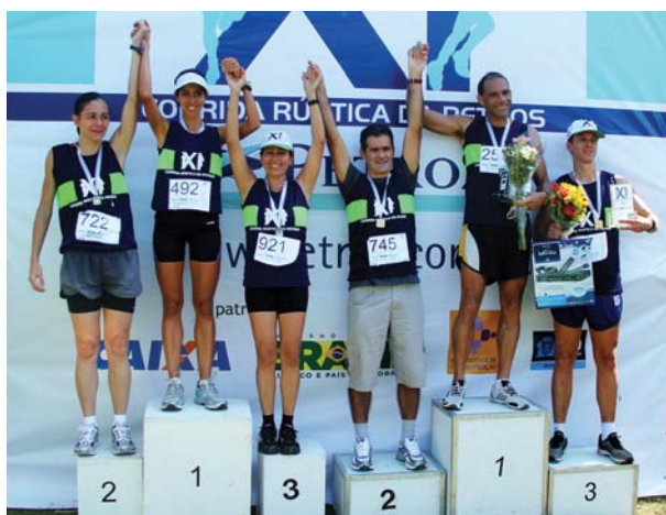
Os vencedores da XI Corrida Rústica da Petros sobem ao pódio